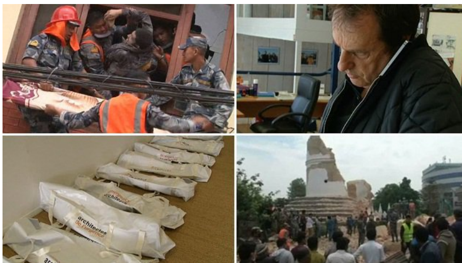
Les Architectes de l'urgence veulent être parmi les premiers à rejoindre le chaos népalais.

C'est le chaos au Népal, suite au séisme qui a touché le pays samedi midi. Le bilan s'alourdit d'heure en heure. Lundi 27 avril à midi, il est de plus de 3500 morts et des milliers de sinistrés. L'aide internationale s'organise avec difficulté. A Amiens, la fondation Architectes de l'urgence prépare son départ.