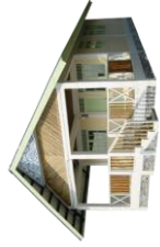
Reconstruction permanente des 3 mois Sustainable rebuilding from 3 months